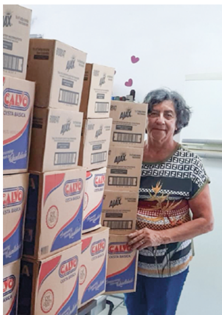
Mais de 500 quilos de produtos de limpeza e de higiene pessoal foram arrecadados em 2022