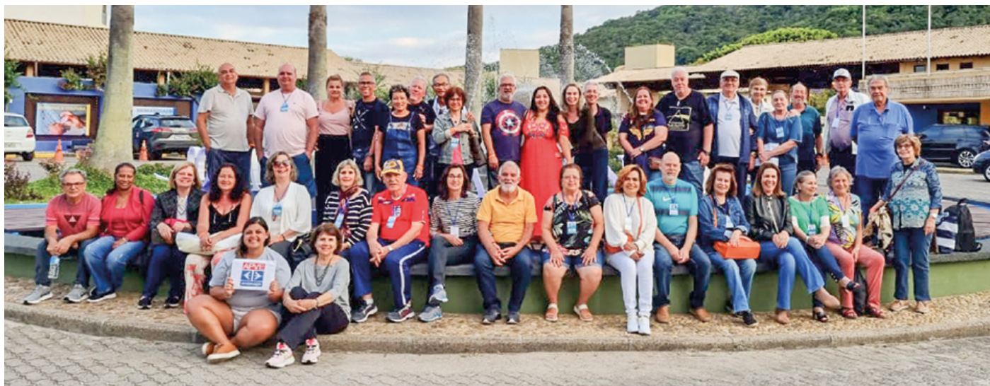
Associados da APVE que participaram da primeira excursão com viagem aérea ao Costão do Santinho (SC)

A primeira viagem feita pela APVE com traslado aéreo veio com cheirinho de mar: Costão do Santinho, em Florianópolis (SC). De 23 a 27 de outubro e de 6 a 10 de novembro, dois grupos de associados embarcaram rumo a quatro dias de muito descanso e de belezas naturais.