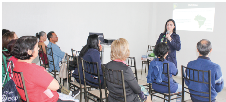
Público participa de palestra durante uma das edições do Ação Saúde

Novembro Azul: prevenção ao câncer de próstata.