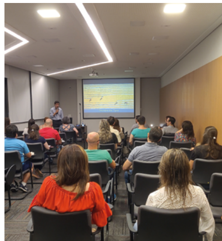
Palestras com ingressos solidários garantiram um bom nível de arrecadação ao longo do ano

Outro ponto importante que foi levado em