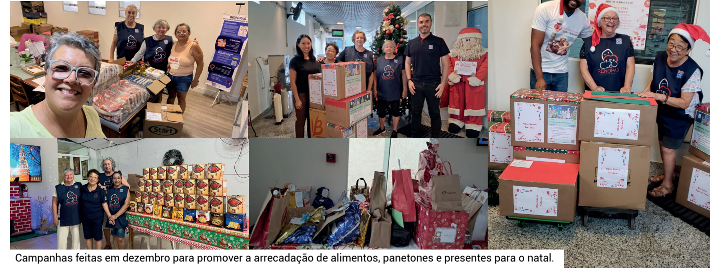
Campanhas feitas em dezembro para promover a arrecadação de alimentos, panetones e presentes para o natal.

As campanhas solidárias realizadas nos últimos meses do ano reforçaram o espírito de colaboração entre os associados e garantiram importantes doações para instituições assistenciais apoiada pela APVE.