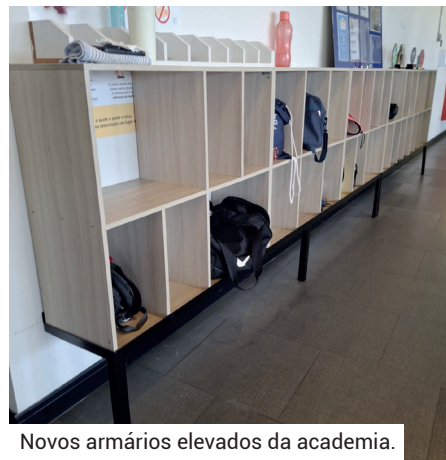
Novos armários elevados da academia.