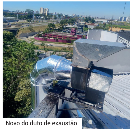
Novo do duto de exaustão.