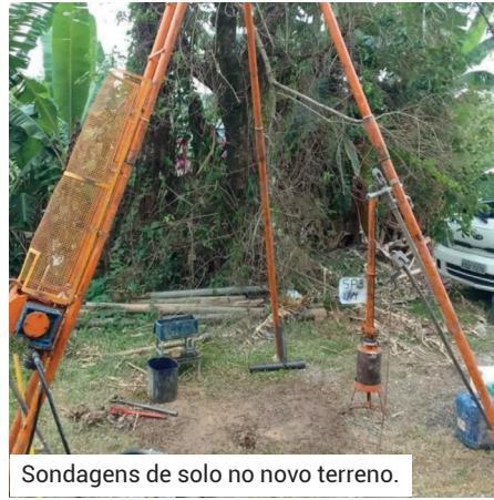
Sondagens de solo no novo terreno.

Essas intervenções fazem parte do programa contínuo de melhorias conduzido pela Diretoria e representam avanços significativos na modernização da infraestrutura da APVE, garantindo mais segurança, funcionalidade, eficiência e conforto para a rotina de todos.