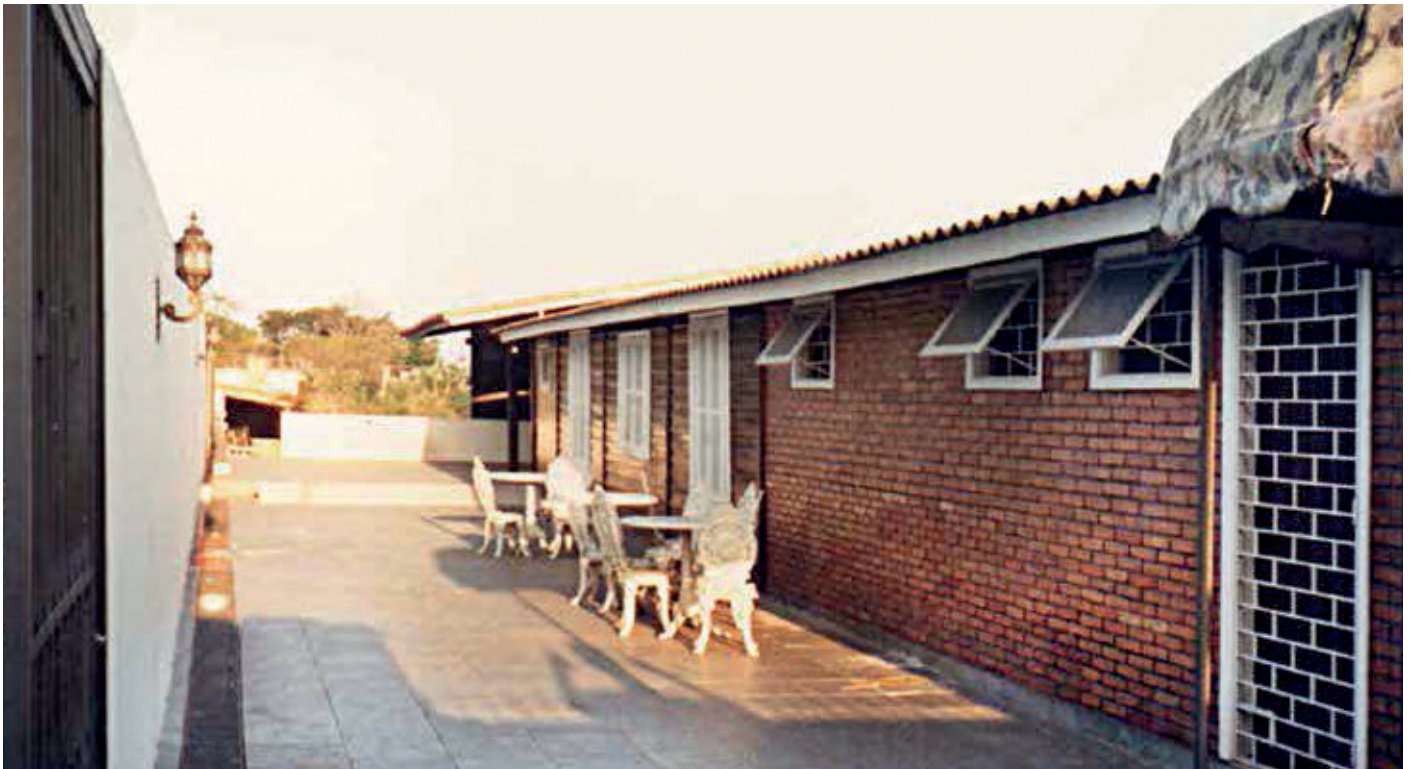
Vista parcial do corredor externo da sede própria da APVE, na Vila Bethania.