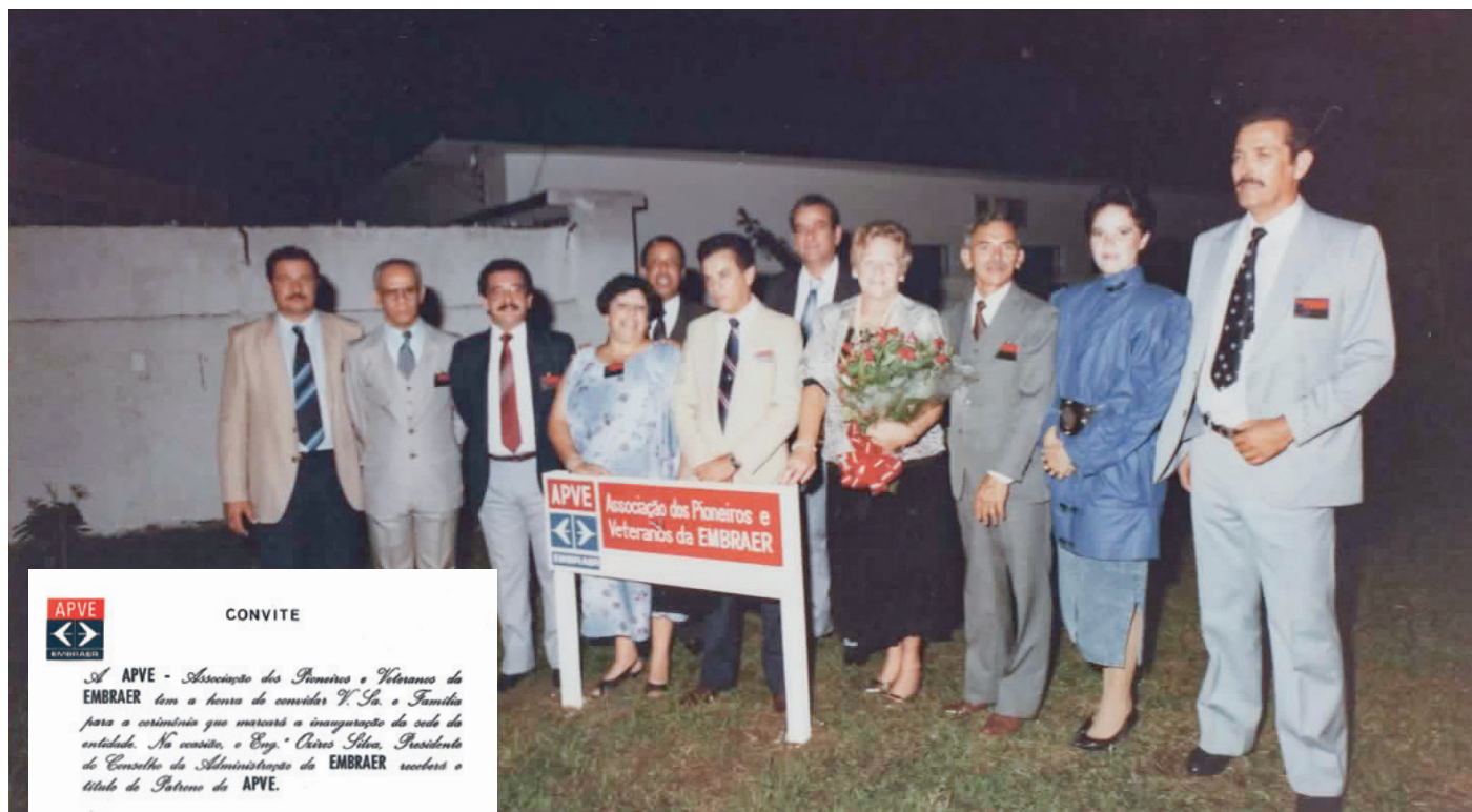
Integrantes da primeira diretoria da APVE na cerimônia de inauguração da sede da rua Paulo Becker.

M eados da década de 1980 - Dos primeiros encontros informais em salas cedidas dentro da Embraer, passando pelas reuniões no prédio F-91, as primeiras sementes lançadas para a criação da APVE tinham como objetivo inicial a preservação do legado de um dos maiores feitos da história moderna brasileira: A criação e consolidação da indústria aeronáutica nacional, um feito mundialmente reconhecido.