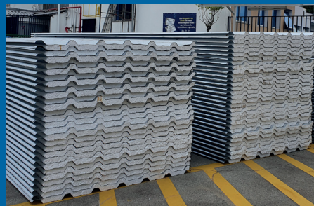
Novo telhado para a recepção e Farmácia

Outra novidade foi a abertura de um novo acesso ligando o subsolo do estacionamento com a academia. Além das obras civis, foi instalada ainda a catraca de acesso que também utilizará o sistema de biometria facial para liberar a entrada dos associados.