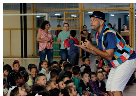
Entrega das caixas de bombom e atividades recreativas da Páscoa Solidária da APVE na escola Escola Estadual José Frederico Marques, no Campo dos Alemães