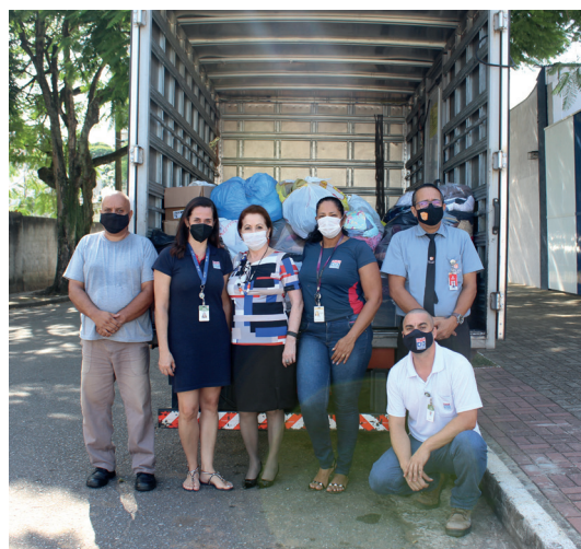
Doações arrecadadas pela APVE embarcadas em caminhão que seguiu para Petrópolis (RJ)

Em poucos dias, os associados da APVE já estavam engajados na ação "Rumo a Petrópolis". No total, todas as frentes voluntárias que participaram da ação garantiram a arrecadação de mais de 7 toneladas de itens como roupas, calçados, utensílios para o lar, fraldas infantis e geriátricas, produtos de higiene pessoal, limpeza, alimentos e água.