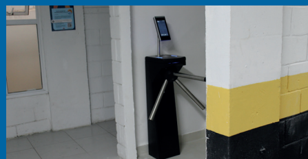
Novo acesso do 3º subsolo para a academia