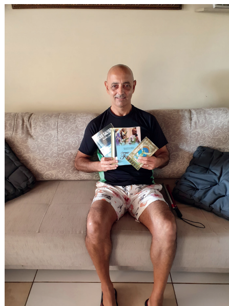
Duca e quatro dos seus 12 livros religiosos já publicados

"Os cegos e os portadores de baixa visão são pessoas que têm grande poder de superação. Vencem obstáculos todos os dias. Eu, por exemplo, frequento a APVE, atuo na área de marketing, sou pai de um garoto lindo, enfim tenho uma vida ativa. A conscientização sobre nossa condição e sobre como podemos e queremos ser orientados corretamente no dia-a-dia pode criar uma sociedade melhor e colaborar para a diminuição do preconceito", disse.